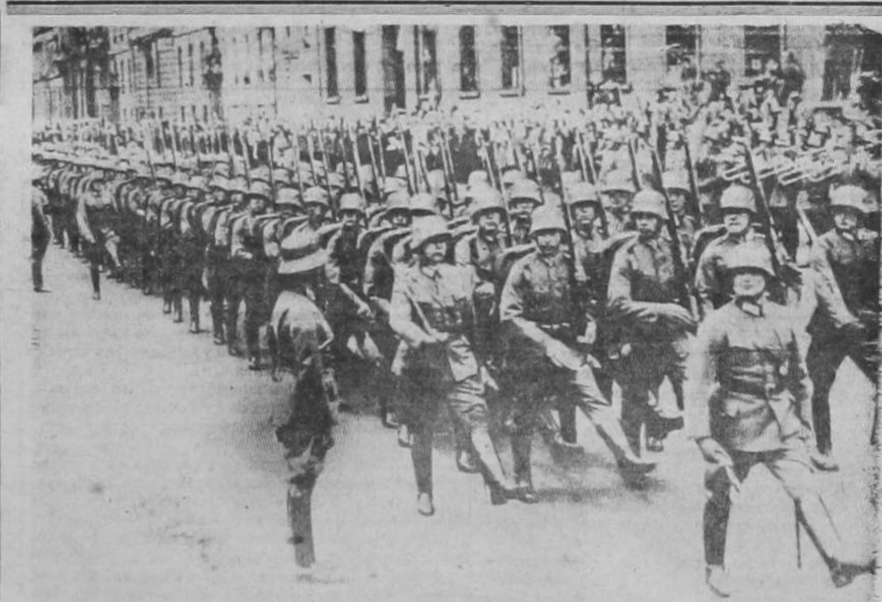
La marcha de los ejércitos alemanes sobre Polonia, fué captada por la cámara de NOVEDADES hace cinco días, transmitida por telefoto a Nueva York y por avión a nuestro rotativo.